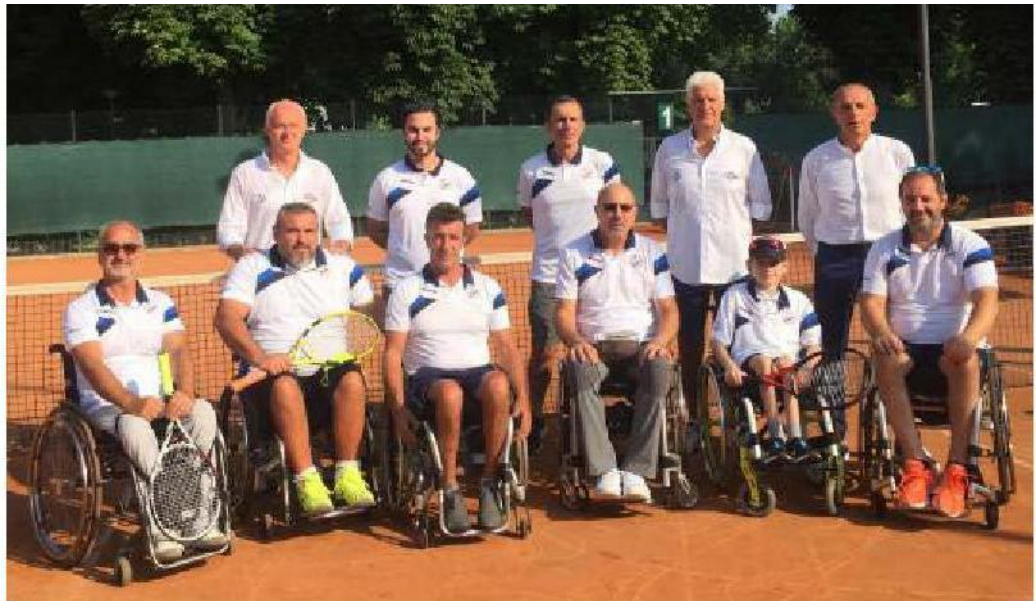
La squadra di tennis in carrozzina della Baldesio con i dirigenti

Anche quest'anno, come da tradizione, i giocatori e i volontari indosseranno la maglietta ufficiale del Torneo, offerta da Pmg Italia: verde, come la speranza e la voglia di ripresa, non limitata ovviamente alle sole attività sportive.