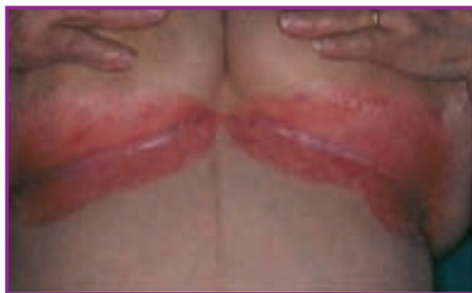
Fig. 10 - Candidoză la nivelul pliurilor submamare.