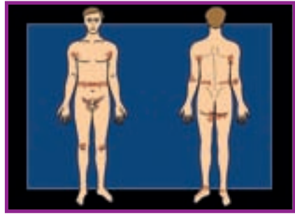
Fig. 2 - Scabia . Localizările cutanate cele mai frecvente.