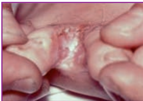
Fig. 11 - Candidoză în spațiul interdigital al piciorului.