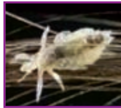
Fig. 5 - Păduchiul, sau pediculus humanus capitis .