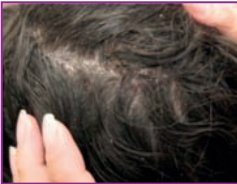
Fig. 4 - Pediculoza capului . Se observă păduchii între firele de păr.