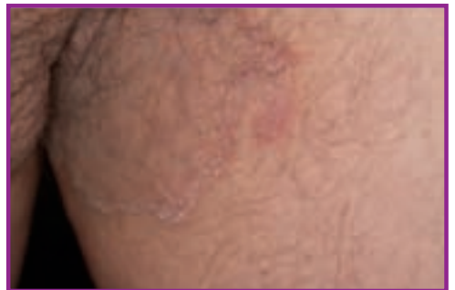
Fig. 8 - Tinea cruris pe suprafața interioară a coapsei.