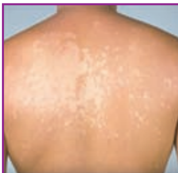
Fig. 12 - Pityriasis versicolor pe spate.