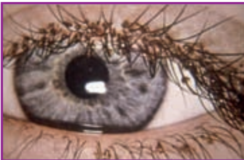
Fig. 7 - Pediculoză la nivelul sprâncenelor.