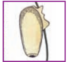
Fig. 6 - Oul păduchiului, asemănător cu o picătură ( lindină ), care este atașat strâns de păr.