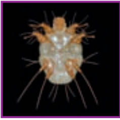
Fig. 1 - Acarianul scabiei ( Sarcoptes scabiei ).