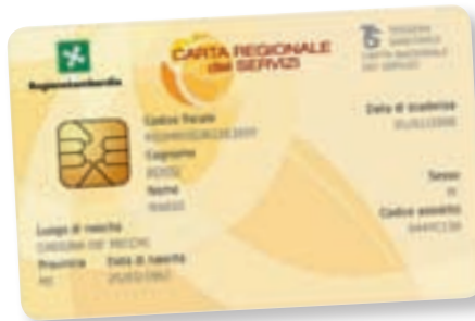
الشكل 1. مثال عن البطاقة الصحية TS (لومبارديا).

تستقبل عيادة الكاريتاس Ambulatorio Caritas في فوغيرا (بافيا) الأشخاص الذين ليس لهم تأمين صحي كل يوم خميس من الساعة 15 و حتى الساعة 18. دون لزوم حجز موعد مسبق.