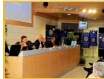
PAG. 8 - CELEBRATO A MANTOVA IL CONGRESSO DISTRETTUALE