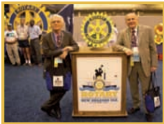
PAG. 2 - A NEW ORLEANS CON GRANDE ENTUSIASMO

L'anno rotariano che comincia sarà quindi caratterizzato da una prima azione: rafforzare la famiglia, non solo la famiglia privata di ciascuno di noi, ma anche la famiglia del Rotary. Una seconda azione sarà relativa allo scoprire cosa abbiamo dimostrato di saper fare bene e a orientare le nostre scelte in modo da sviluppare ulteriormente queste capacità; la continuità con quanto fatto bene nel passato è quindi una scelta obbligata per ampliare il successo ottenuto, al fine di aiutare in modo efficace un maggior numero di persone in futuro. La società in cui viviamo è soggetta a continue, grandi trasformazioni e il Rotary non può non tenerne conto: una terza azione deve essere il cambiamento, affinché il Rotary e i suoi interventi sulla società siano allineati o addirittura prevenivano le esigenze del mondo in cui viviamo. E' un programma ambizioso che si appoggia in maniera determinante sul Rotariano, sulle sue convinzioni, aspirazioni, desideri, professionalità; le strutture burocratiche e l'organizzazione del Rotary sono importanti, come sono importanti le risorse economiche, ma solo in quanto funzionali alle azioni che il Rotariano saprà progettare e sviluppare e da questo punto di vista devono essere giudicate. La sede per eccellenza dove il Rotariano esprime queste sue qualità è il Club e, quindi, è il Club che deve essere al centro della nostra attenzione se veramente vogliamo valorizzare le