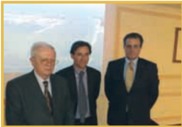
PAG. 6 - IN LAGUNA PER STUDIARE IL SISTEMA MOSE