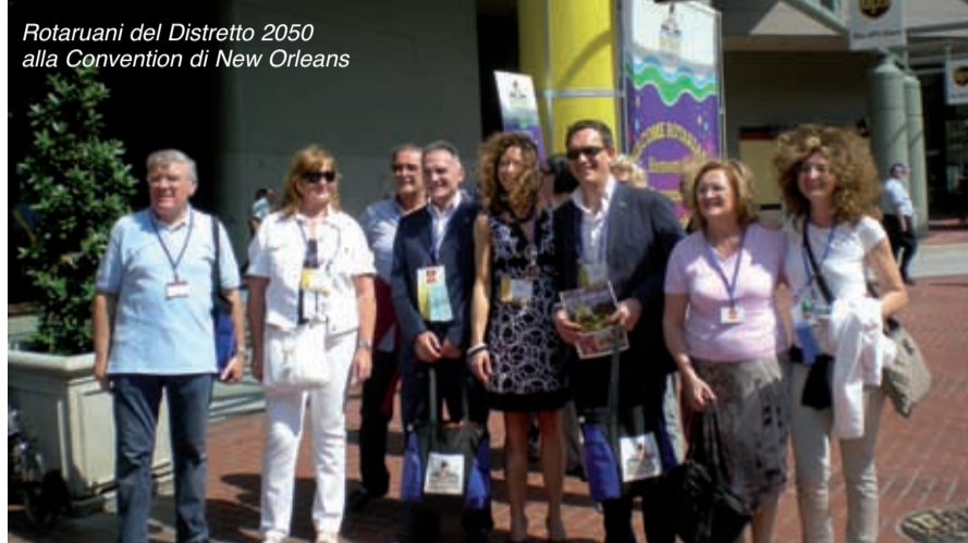
Rotariani del Distretto 2050 alla Convention di New Orleans

ha dato vita da alcuni anni alla Fondazione umanitaria che ha come scopo quello di sconfiggere la poliomielite nel mondo, soprattutto nei paesi a basso sviluppo; i risul-