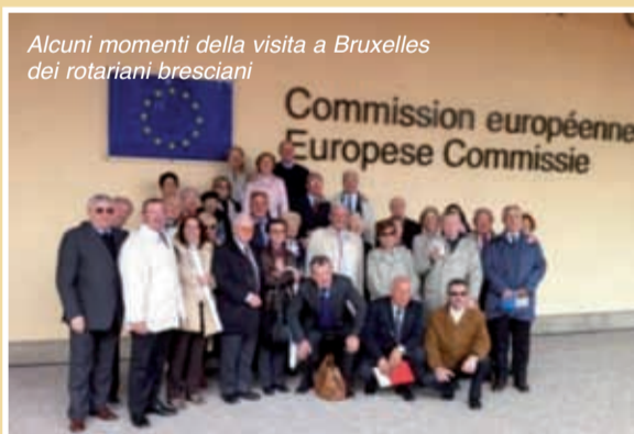
Alcuni momenti della visita a Bruxelles dei rotariani bresciani

Dopo un excursus turistico a Gand e Bruges, oltre che a Bruxelles, il club visitato il Comitato econo-