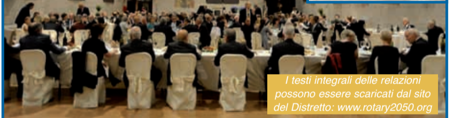
I testi integrali delle relazioni possono essere scaricati dal sito del Distretto: www.rotary2050.org