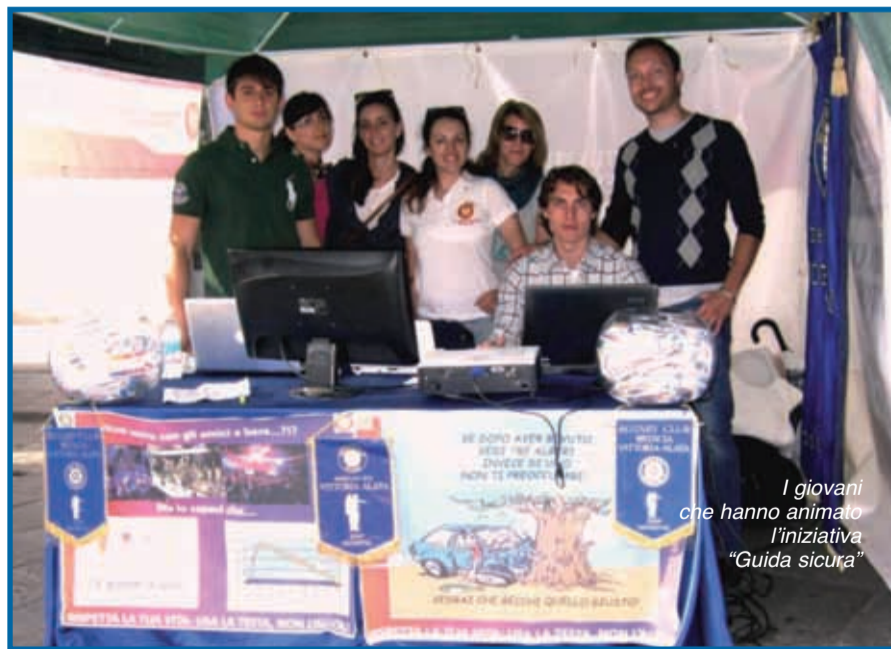
I giovani che hanno animato l'iniziativa "Guida sicura"

Mai il cuore della città è apparso tanto sfrigorante di colori, musica, voci e, perfino, sotto il portichetto dell'ala sud della piazza, "caciariato" da cinque studenti che si lanciavano un micro palloncino di rugby, incuranti del messaggio che veniva dai compagni impegnati in esercitazioni, attenti, seduti da-