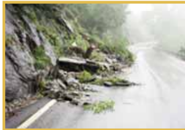
PAG. 5 - NASCONO AL ROTARY LE LINEE-GUIDA ANTIFRANE