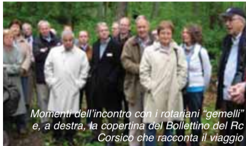
Momenti dell'incontro con i rotariani "gemelli" e, a destra, la copertina del Bollettino del Rc Corsico che racconta il viaggio