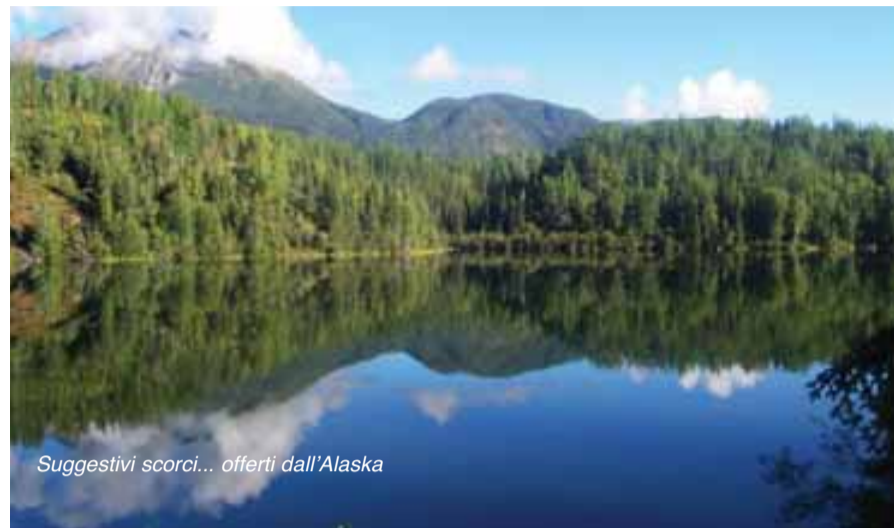
Suggestivi scorci... offerti dall'Alaska