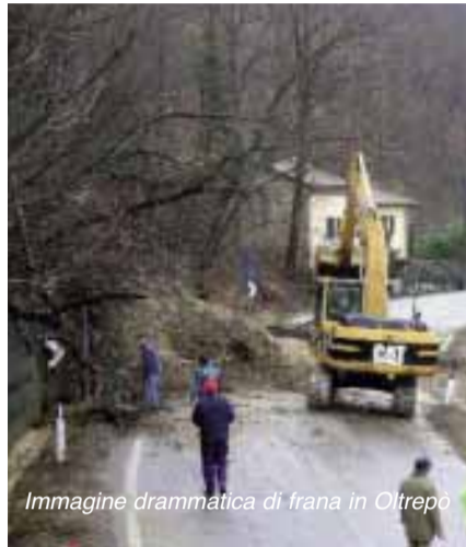
Immagine drammatica di frana in Oltrepò