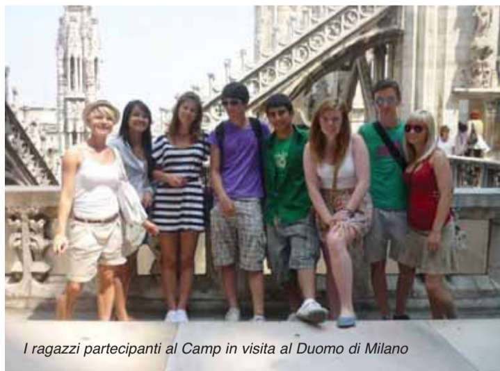
I ragazzi partecipanti al Camp in visita al Duomo di Milano

La permanenza presso le famiglie rotariane si è conclusa con una conviviale alla quale hanno partecipato i tre Club con i loro soci e ospiti. E' stato un incontro ricco di emozioni e di festa in cui tutti i ragazzi hanno espresso i loro ringraziamenti e le loro impressioni. Il presidente