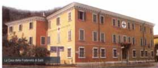
La Casa della Fraternalità di Salò

La complessità e la difficoltà del lavoro ha però costretto le Ancelle della Carità, dopo 25 anni di preziosissimo impegno, a lasciare; subentreranno