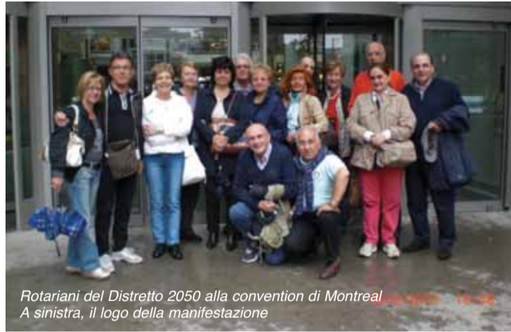
Rotariani del Distretto 2050 alla convention di Montreal. A sinistra, il logo della manifestazione

Queen Noor ha fatto spillare le mani a tutti ancora e molto più dei pur bravissimi "Celtic Thunder", un complesso irlandese che l'irlandese Presidente Kenny aveva voluto per la parte riguardante l'intrattenimento.