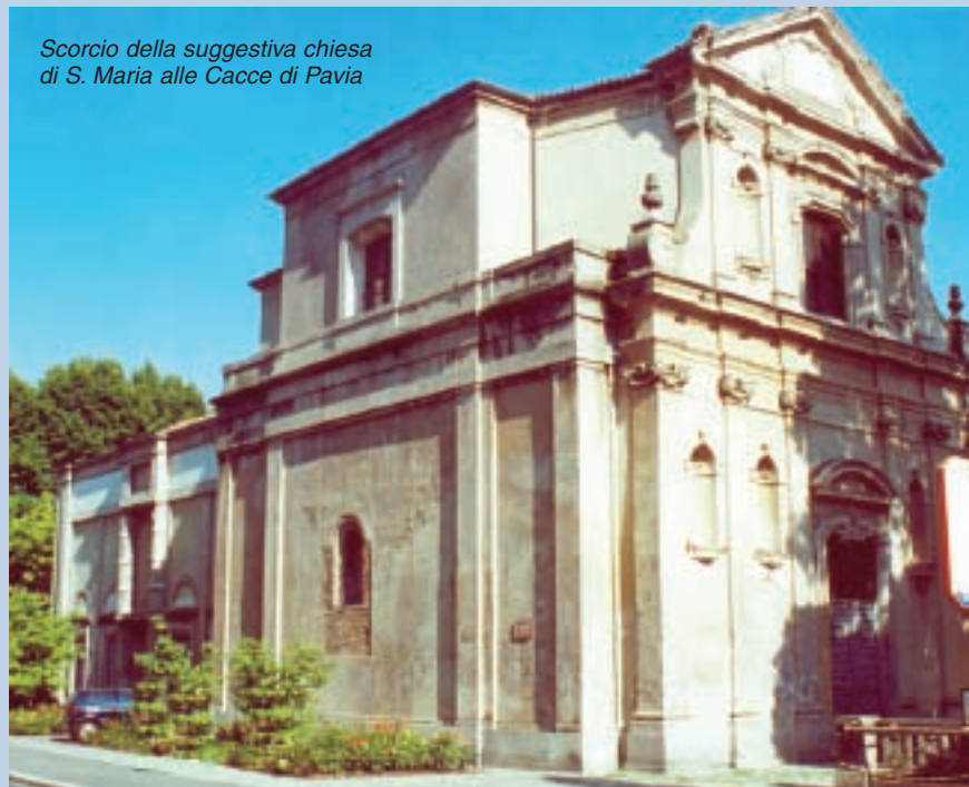
Scorcio della suggestiva chiesa di S. Maria alle Cacce di Pavia