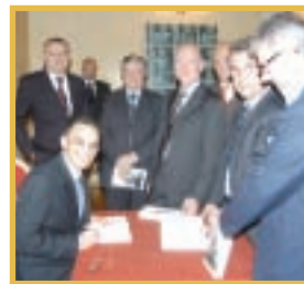
PAG. 5 - MAGDI ALLAM SPIEGA LA SUA CONVERSIONE