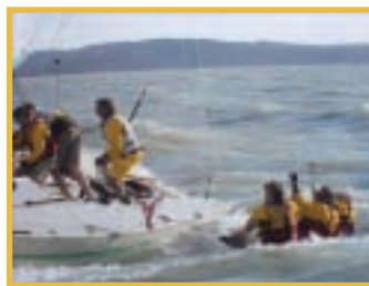
PAG. 2 - OK IL TROFEO "UNA VELA PER LA RUOTA"

L'aggiudicazione di uno dei premi può permettere agli ideatori di veder realizzare il proprio progetto, attuando un sogno, in sintonia con il motto "Make dreams real", tema scelto dal presidente del Rotary International per l'anno 2008-09. (p.z.)