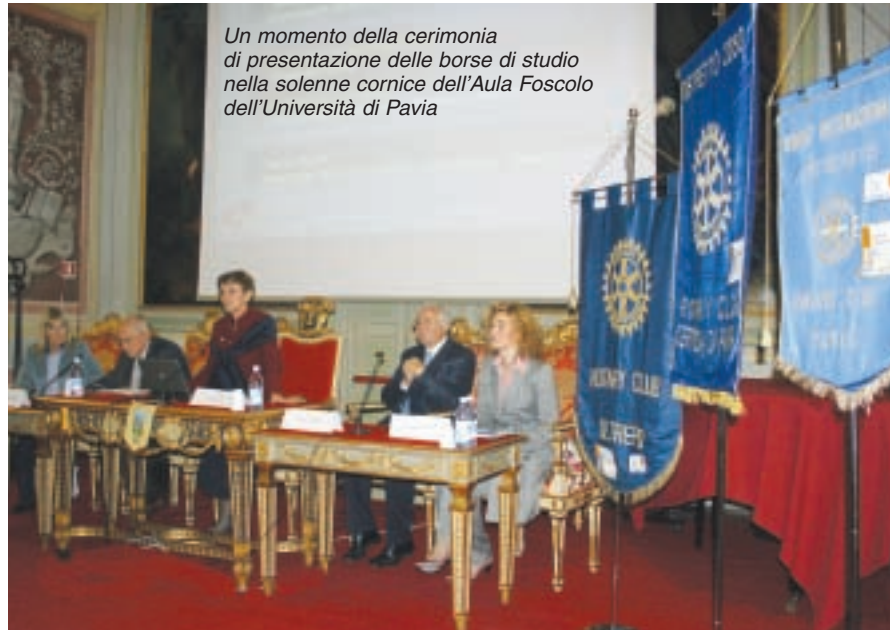
Un momento della cerimonia di presentazione delle borse di studio nella solenne cornice dell'Aula Foscolo dell'Università di Pavia

Avvalendosi di immagini di grande efficacia ha parlato di questa campagna di eradicazione mondiale della poliomielite la cui portata