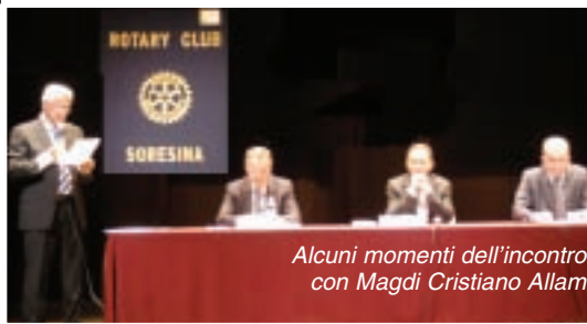
Alcuni momenti dell'incontro con Magdi Cristiano Allam