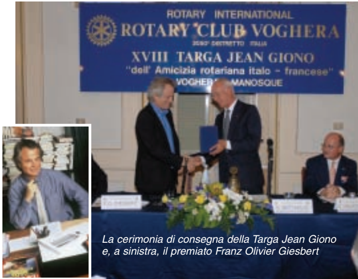
La cerimonia di consegna della Targa Jean Giono e, a sinistra, il premiato Franz Olivier Giesbert

in Francia. Inizia la carriera giornalistica collaborando alla pagina letteraria di Paris-Normandie, quindi entra al Nouvel Observateur come giornalista politico e ne diventa in breve direttore della redazione. Entra poi al Figaro di cui diverrà membro della direzione e direttore generale di Figaro Magazine e Madame Figaro. Nel 2000 è direttore del Point e dal 2004 ne è presidente e direttore generale.