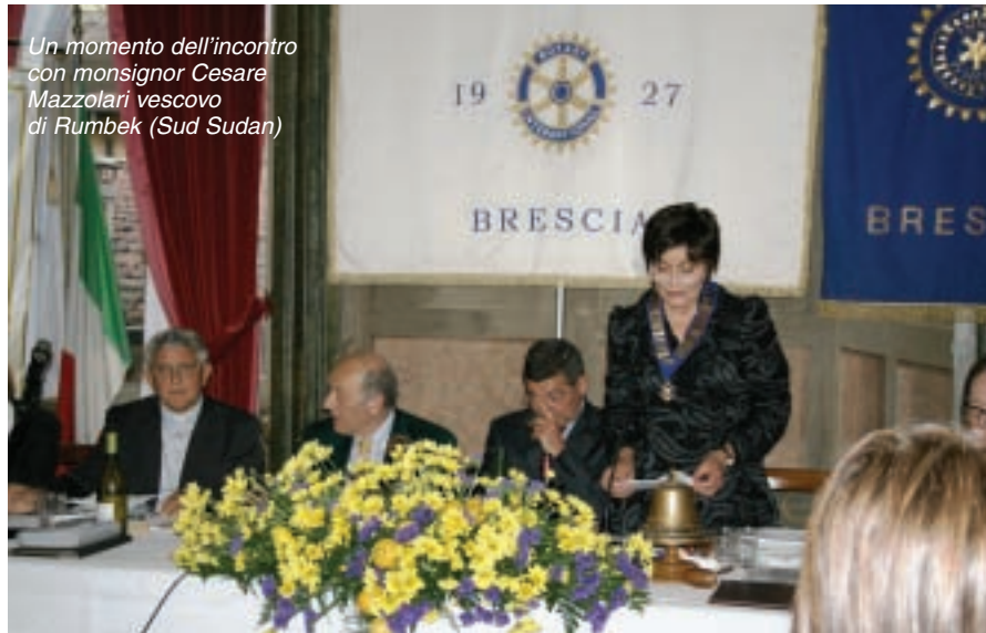
Un momento dell'incontro con monsignor Cesare Mazzolari vescovo di Rumbek (Sud Sudan)

Tutti i dodici club bresciani allora esistenti hanno partecipato alla raccolta iniziale dopo quella del club Brescia: particolarmente generosa l'offerta del neonato club di Manerbio. E' seguita l'attività generosa e originale del socio Guizzi (asta muta), mentre il lascito di 50 milioni di vecchie lire del past president