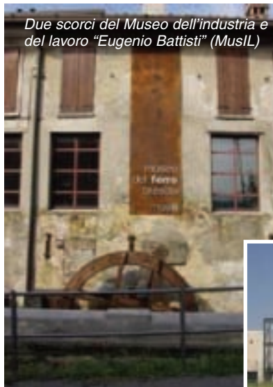
Due scorci del Museo dell'industria e del lavoro "Eugenio Battisti" (MusIL)

Tra i punti di forza del progetto c'è sicuramente una collezione che rende disponibile