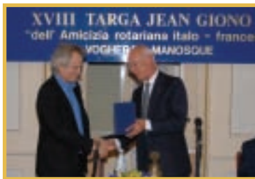
PAG. 4 - IL RC VOGHERA CONSEGNA LA TARGA GIONO