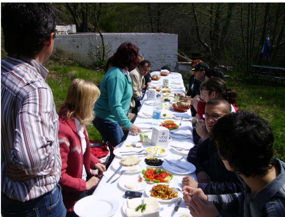
Colazione con gli amici di Luleburgaz