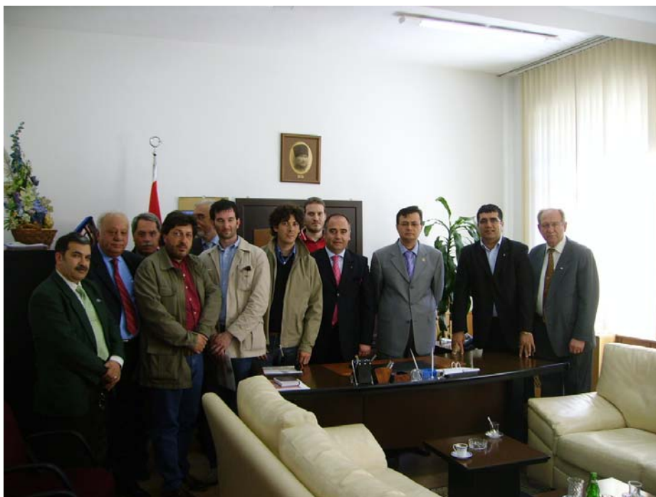
Dal procuratore della repubblica Corlu