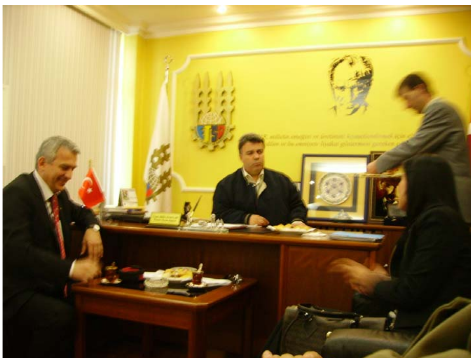
Visita alla camera di commercio di Edirne e incontro con il presidente