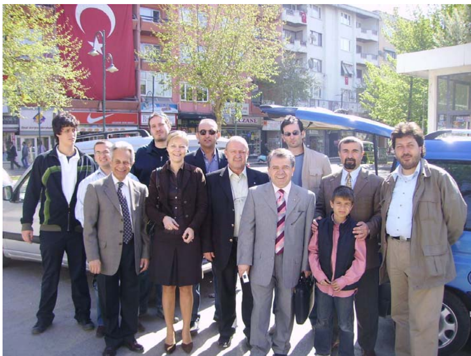
Foto di gruppo con gli amici di Luleburgaz