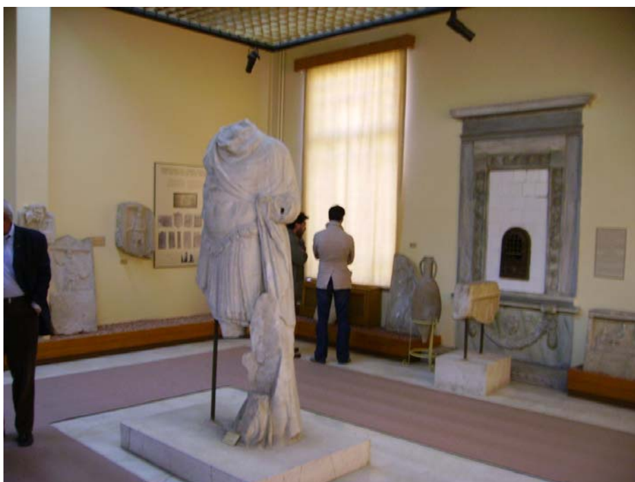
Visita al Museo vicino a Corlu