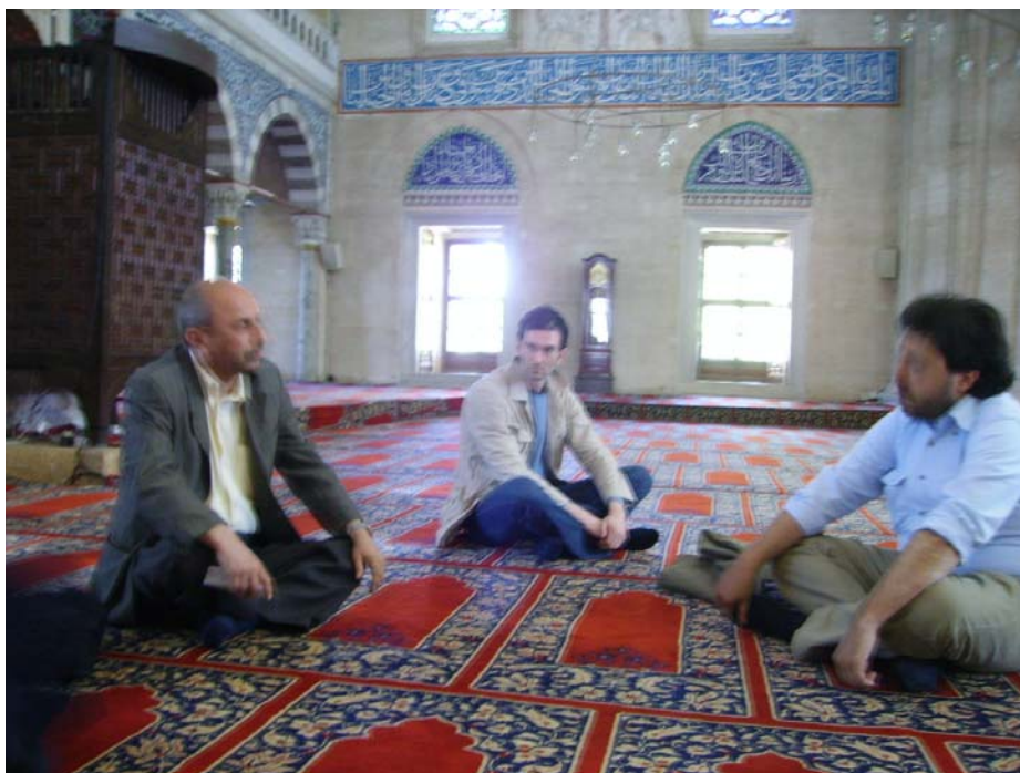
Dentro la moschea