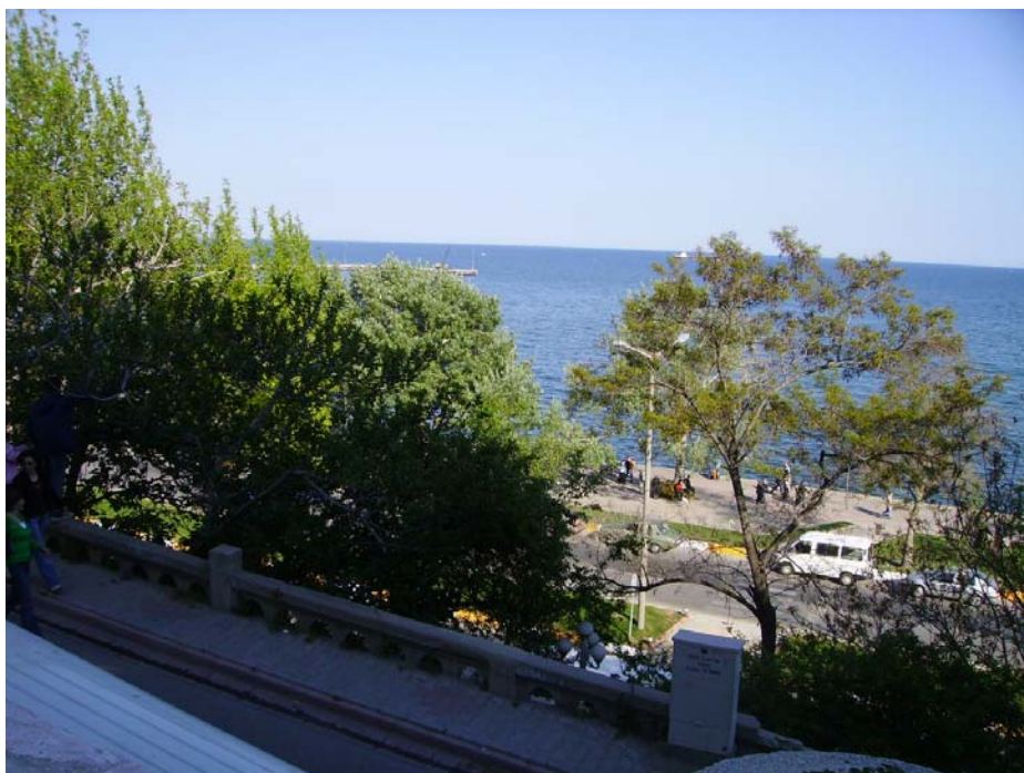
Mar di Marmara vicino Corlu