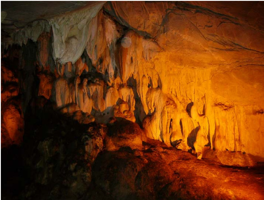
Le Grotte di Luleburgaz