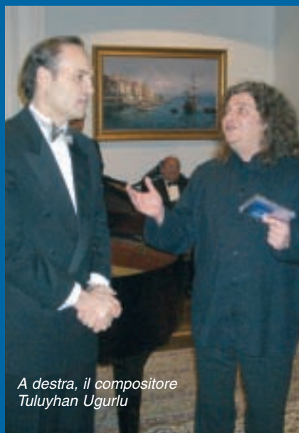
A destra, il compositore Tuluyhan Ugurlu

Il concerto, organizzato con il patrocinio delle autorità diplomatiche turche in Italia, si terrà sabato 31 marzo alle ore 20 presso le Officine del Volo, a Milano. Davvero speciale l'obiettivo che si andrà a centrare: il sostegno al Progetto 3H , uno tra i più rilevanti della storia della Fondazione Rotary, lanciato dal Distretto 2420 e subito sposato dal 2050.