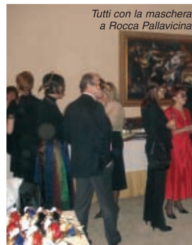
Tutti con la maschera a Rocca Pallavicina