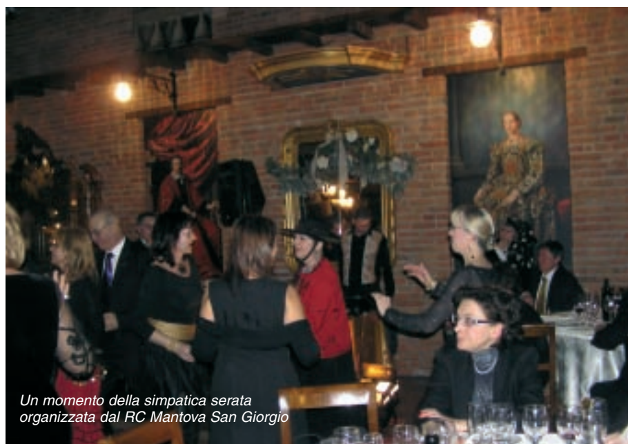
Un momento della simpatica serata organizzata dal RC Mantova San Giorgio