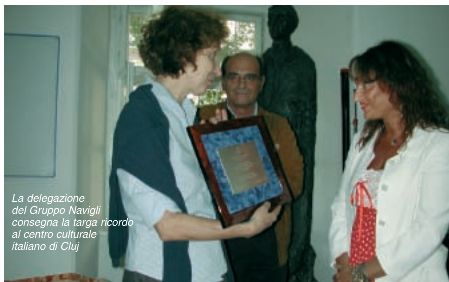
La delegazione del Gruppo Navigli consegna la targa ricordo al centro culturale italiano di Cluj

IL RC ASSAGO MILANOFIORI CON I CLUB DEL GRUPPO NAVIGLI SOSTIENE IL CENTRO CULTURALE DI CLUJ