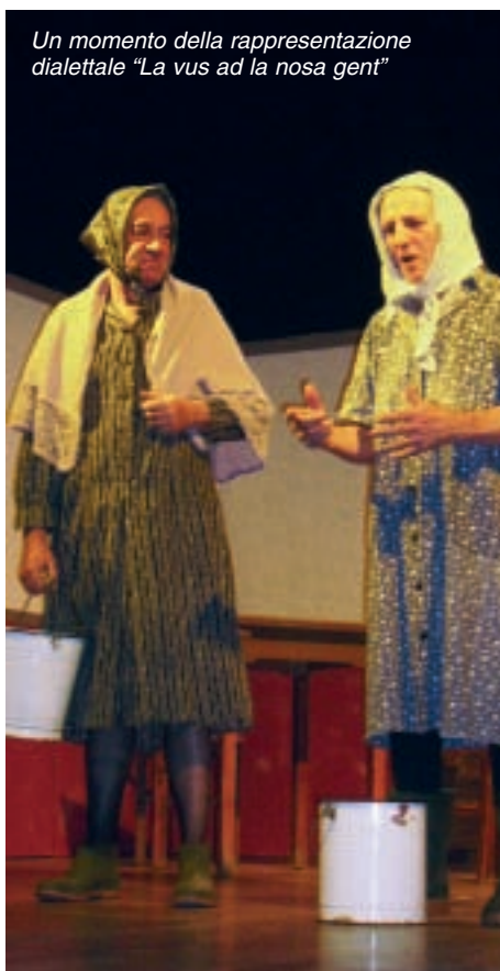
Un momento della rappresentazione dialettale "La vos ad la nosa gent"

Un particolare ringraziamento il Club lo ha rivolto a tutto il gruppo teatrale Ami di Tromello per la grande disponibilità e professionalità, all'Amministrazione comunale di Garlasco e al sindaco Enzo Spialtini presente alla serata benefica, agli sponsor che hanno contribuito alla riuscita della rappresentazione, nel miglior auspicio che presto si possa debellare la polio in tutto il mondo.