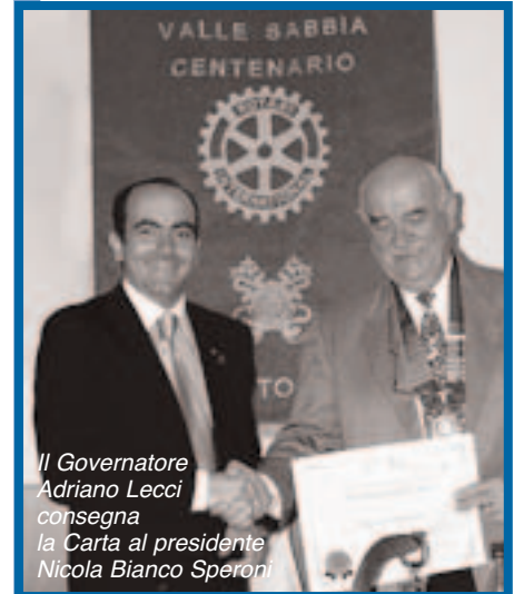
Il Governatore Adriano Lecci consegna la Carta al presidente Nicola Bianco Speroni

Spesso ci domandiamo perché la voce degli esperti, dotati di una corretta soluzione tecnica ai problemi, non venga ascoltata al momento di prendere delle decisioni, ad esempio in politica, e prevalgano invece soluzioni diverse, apparentemente meno meditate. Il fatto è che i processi politici sono dominati da una competizione a tutto campo fra attori con interessi divergenti e l'esperto, una volta entrato nell'arena pubblica, diventa sempre, e inevitabilmente parte di un gioco politico competitivo e deve accettarne le regole.