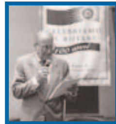
PAG. 3 - IL MUSEO DELL'IMPRENDITORIA