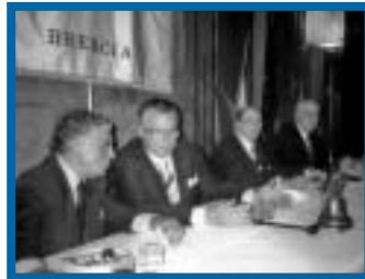
PAG. 5 - DA WASHINGTON AL ROTARY DI BRESCIA