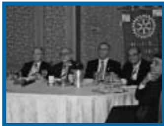
PAG. 4 - IL CINEMA E LE SUE CANZONI