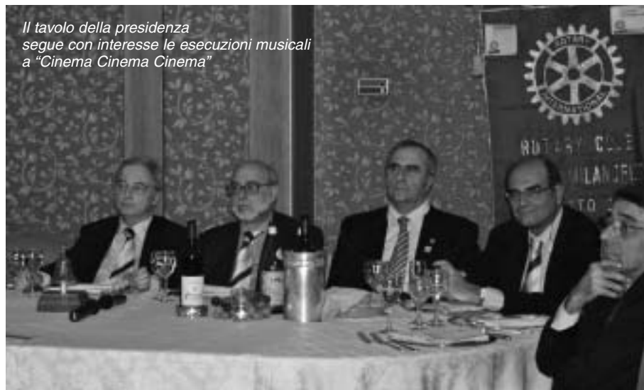
Il tavolo della presidenza segue con interesse le esecuzioni musicali a "Cinema Cinema Cinema"